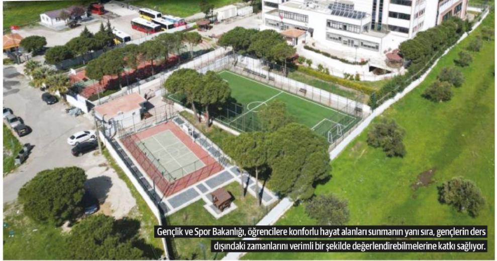
Gençlik ve Spor Bakanlığı, öğrencilere konforlu hayat alanları sunmanın yanı sıra, gençlerin ders dışındaki zamanlarını verimli bir şekilde değerlendirebilmelerine katkı sağlıyor.