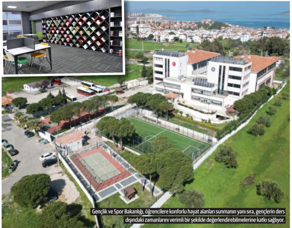
Gençlik ve Spor Bakanlığı, öğrencilere konforlu hayat alanları sunmanın yanı sıra, gençlerin ders dışındaki zamanlarını verimli bir şekilde değerlendirebilmelerine katkı sağlıyor.