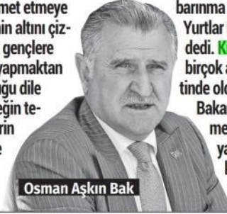
Osman Aşkın Bak

versitelerde 2024-2025 eğitim öğretim yılının başlayacağına değinen Bak, "180 bin olan yurt kapasitesini 980 binlere taşıdık. Gençlerimize sabah kahvaltısı ve akşam yemeğini ücretsiz olarak devletimiz sağlıyor. Büyük bir barınma gücüne sahip Kredi Yurtlar Kurumunu yönetiyoruz" dedi. Kredi Yurtlar Kurumu 'nun birçok afette milletin hizmetinde olduğunu altını çizen Bakan Bak, Kahramanmaraş merkezli depremlerde yaklaşık 1 buçuk 5 milyon kişinin yurtlarda misafir edildiğini söyledi.